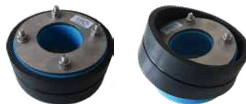
BAGUES DE COMPENSATION