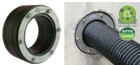
PRESSIO® STEEL REGULAR pour tube pré-isolé / gaine annelée (tuyau très souple) de largeur 80 mm.