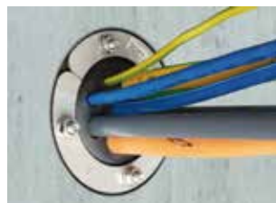
PRESSIO® STEEL UNIVERSAL multicâble (> 4).