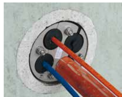
PRESSIO® STEEL UNIVERSAL SPLIT – SPÉCIAL CÂBLES

En version « borgne », les PRESSIO® STEEL SPLIT UNIVERSAL restent parfaitement étanches.