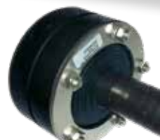
PRESSIO® STEEL UNIVERSAL