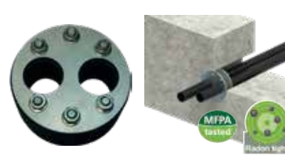
PRESSIO® STEEL REGULAR fabrication sur-mesure.