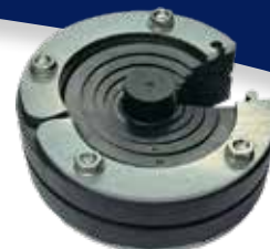
PRESSIO® STEEL UNIVERSAL SPLIT