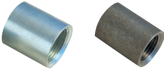
Taraudage cylindrique femelle Rp - EN 10226-1 et ISO 7-1 Female parallel thread Rp - EN 10226-1 and ISO 7-1