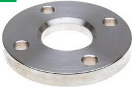
Brida Loca de Aluminio Aluminium Loose Flange