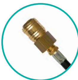
CONNEXION RAPIDE FEMELLE