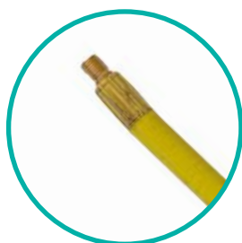
VALVE SCHRADER MÂLE