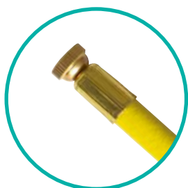
VALVE SCHRADER FEMELLE

Liste des différents embouts de nos accessoires de gonflage compatibles avec la gamme FLO-BLOC ® .