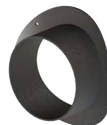
PIÈCE NUE, SANS CLAPET

Autres dimensions sur-mesure, nous consulter.